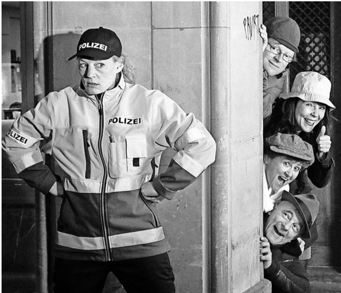
«Über die Verhältnisse» ist eine hintersinnige Komödie mit Spielwitz und Tempo.

Das Ergebnis soll rasant sein: «Man muss genau hinschauen und darf sich nicht ablenken lassen», weiss Feer. Zum ändern – und aus der Sicht von Hörenden ist das wohl die Hauptqualität – ist die